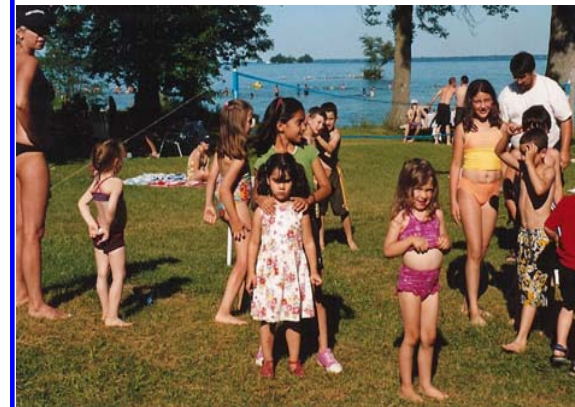
Più di 30 bambini si sono divertiti al picnic