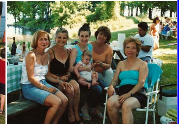
Il bebè più coccolato! (fortunato lui)