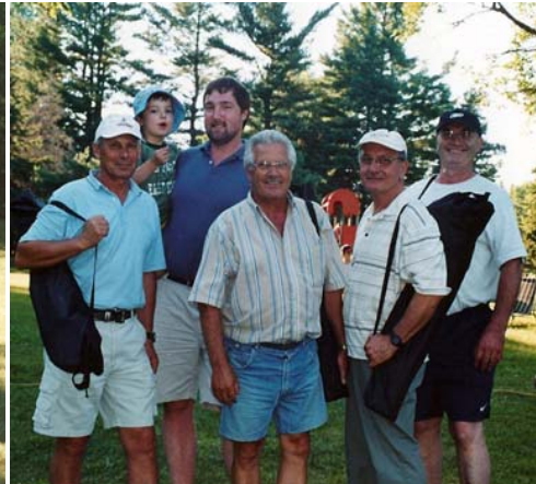
I vincitori del gioco delle bocce