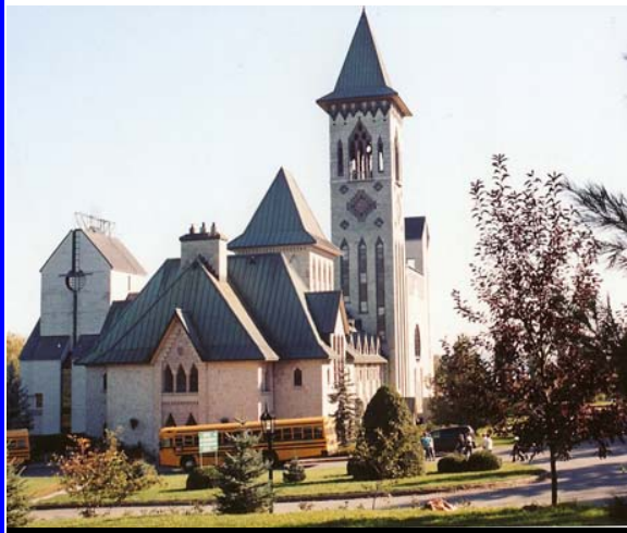
La cattedrale di St. Benoit du Lac