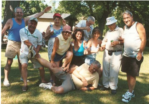
Tutti si sono divertiti

L'evento si è svolto a Glengarry Parc. Hanno partecipato intere famiglie, dai nipoti ai bisnonni: circa 250 persone di tutti i livelli d'età. Furono organizzate attività per tutti i partecipanti: giochi per i bambini, tiro alla fune, gare di bocce per gli adulti. Cibi e bevande in abbondanza! Una giornata indimenticabile per tutti!