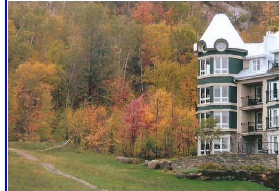
L'autunno multicolore a Mont Tremblant