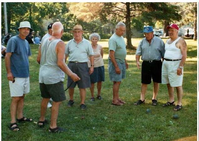
Accaniti giocatori di bocce : Fermi tutti! Si deve misurare !