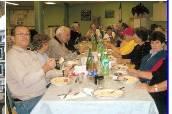
Cena al gioco delle bocce