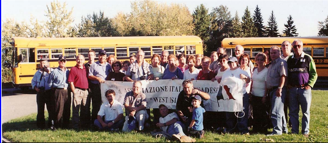
Alcuni dei membri che hanno partecipato alla visita del vigneto

La gita ai vigneti Vignoble de L'Orpailleur a Dunham, Quebec, ebbe luogo il 2 Ottobre 2005. Furono necessari 2 autobus poiché la partecipazione dei nostri membri fu molto numerosa. Durante il viaggio di ritorno, il gruppo si fermò a visitare la cattedrale di St.Benoit du Lac vicino a Magog.