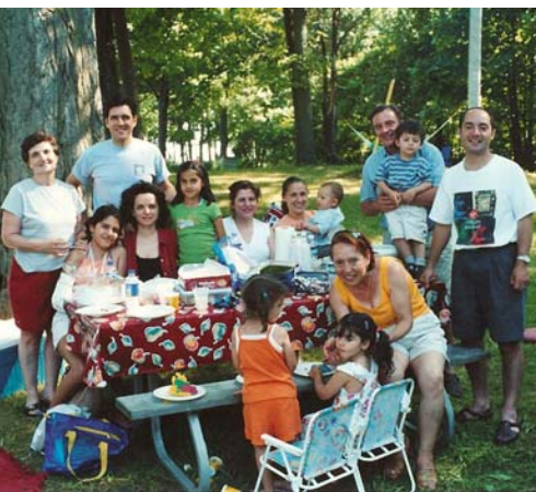
La famiglia Fasanella con i loro bambini