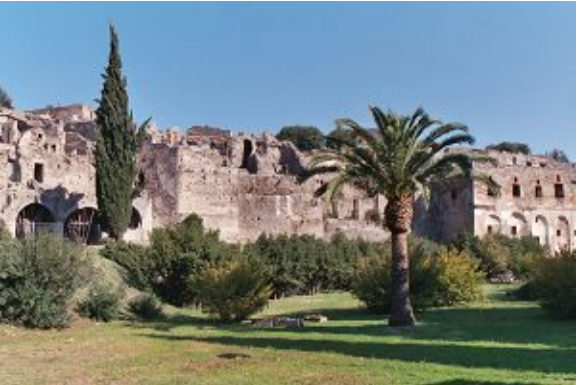
Le rovine della città di Pompei